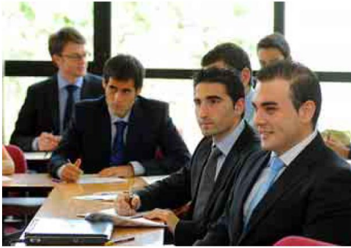
ENAE BUSINESS SCHOOL