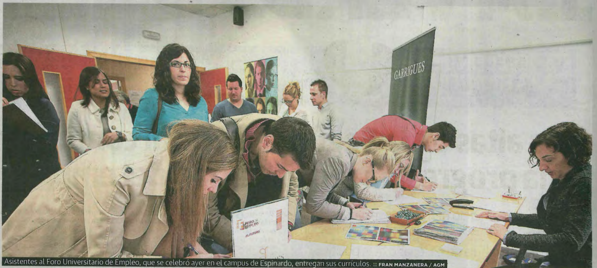
Asistentes al Foro Universitario de Empleo, que se celebró ayer en el campus de Espinardo, entregan sus currículos.

Paro registrado en marzo con respecto al mes anterior