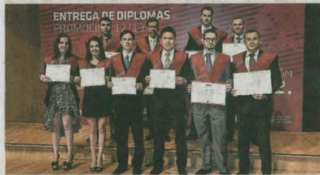
Máster en Logística y Dirección de Operaciones. J.L.