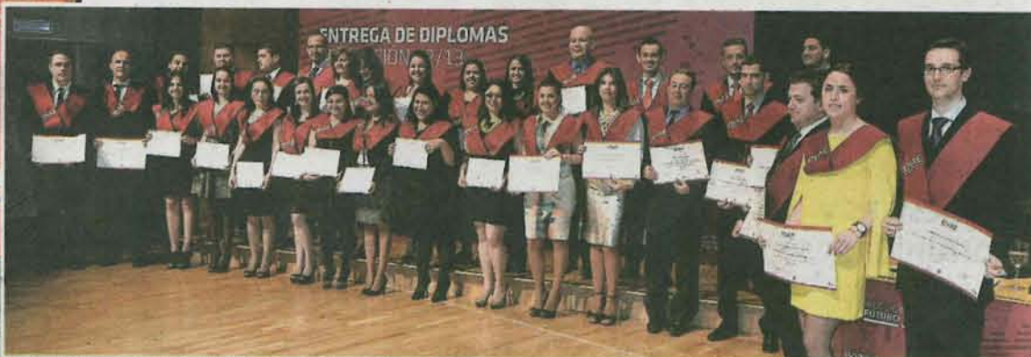
MBA y Executive MBA en Guatemala. J.L.