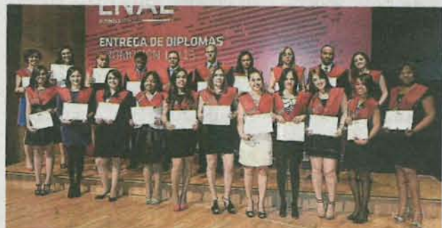
Máster en Dirección Económico Financiera y Gestión de Costes 2013/14. J.L.