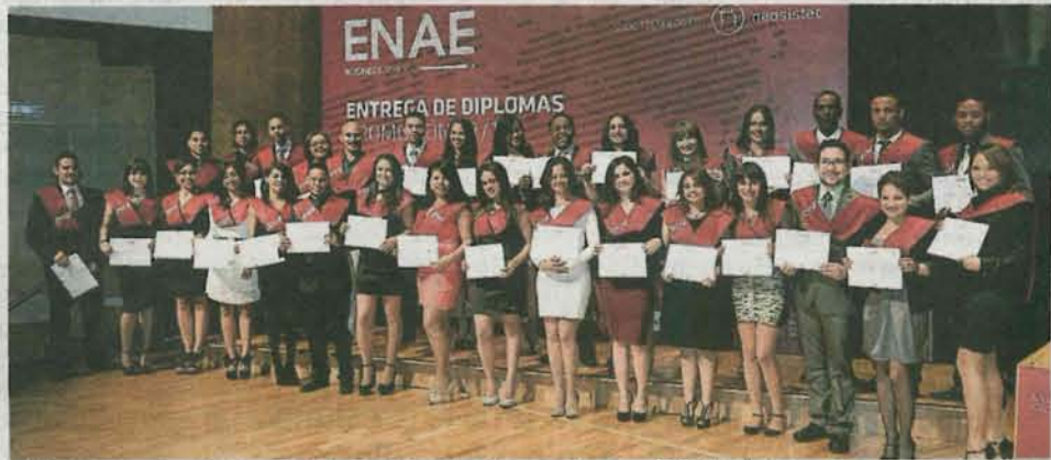
Máster en Logística y Dirección de Operaciones 2013/14. J.L.