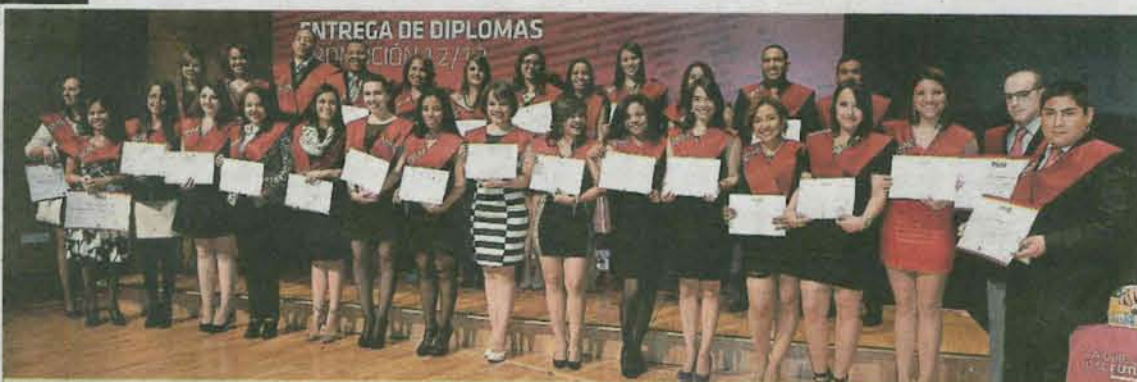
Máster en Dirección y Gestión en Comercio Internacional.