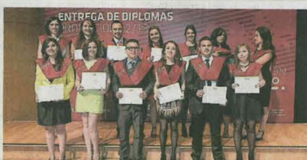
Máster en Dirección Comercial y Marketing 2013. J.L.