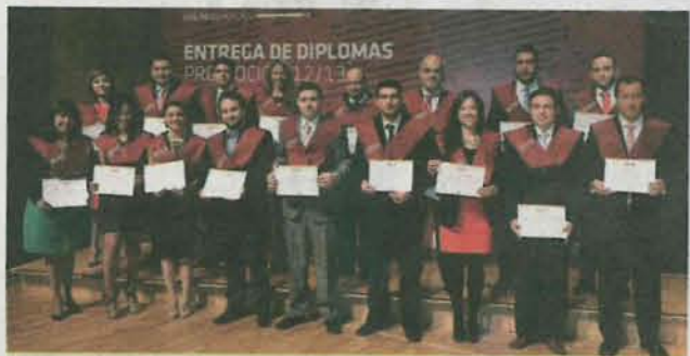
Máster en Marketing Digital y Dirección Comercial Semipresencial 2013. J.L.