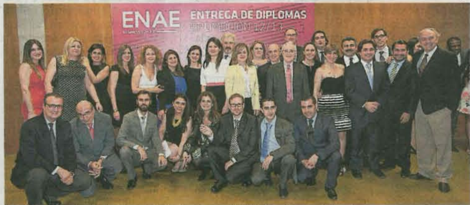
Equipo Fundación Universidad Empresa y ENAE Business School. J.L.

No faltaron el consejero de Universidades, Empresa e Investigación,