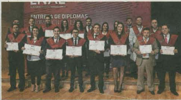
Máster en Dirección Económico-Financiera. J.L.