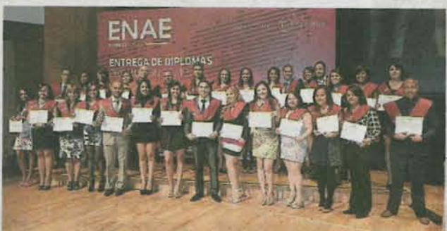
Máster en Logística y Dirección de Operaciones 2013/14