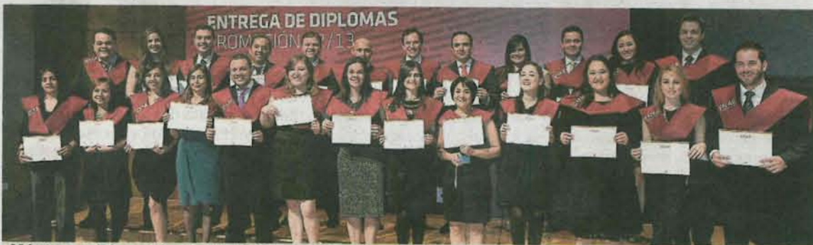
Máster en Dirección de Marketing en Guatemala.