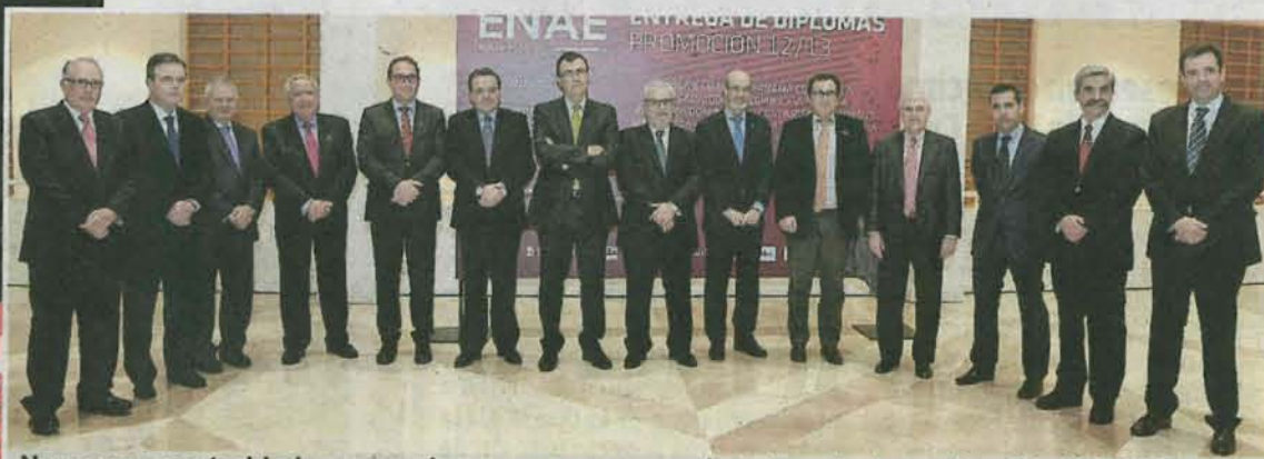
Numerosas autoridades secundaron con su presencia este acto de graduación de ENAE. J.L.