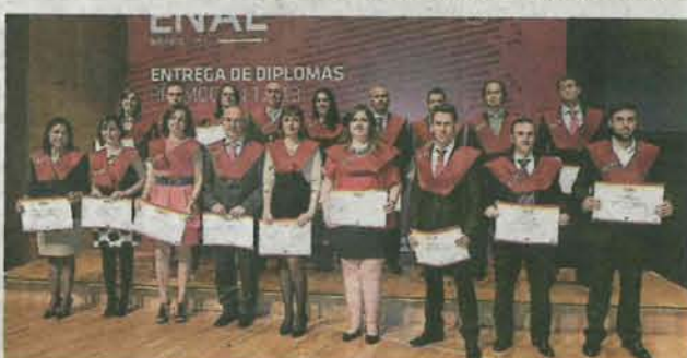
Máster en Auditoría de Cuentas y Máster en Asesoría Fiscal. J.L.