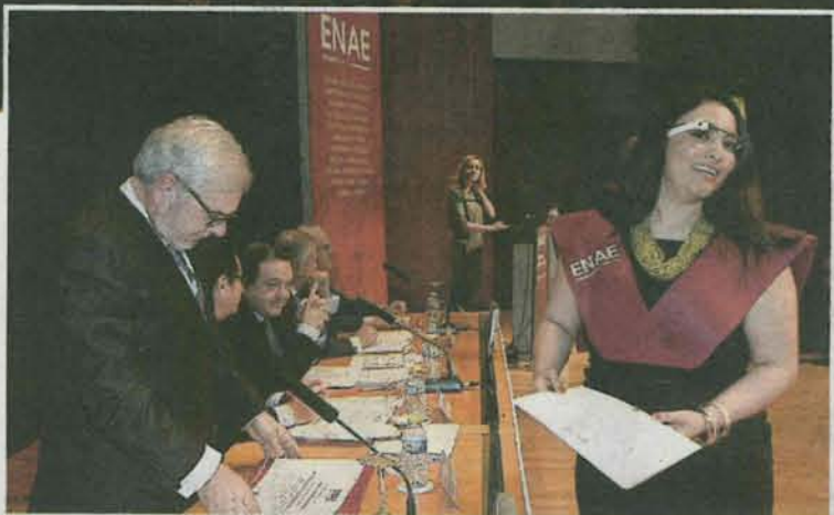
Una alumna del MBA con las Google Glass recoge su diploma. J.L.