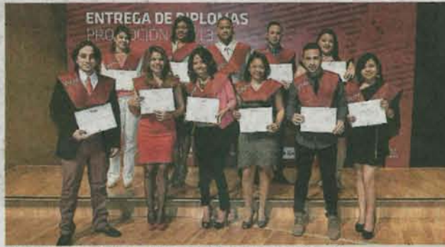
Máster en Dirección de Agronegocio. J.L.