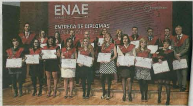
Máster en Dirección Comercial y Marketing.